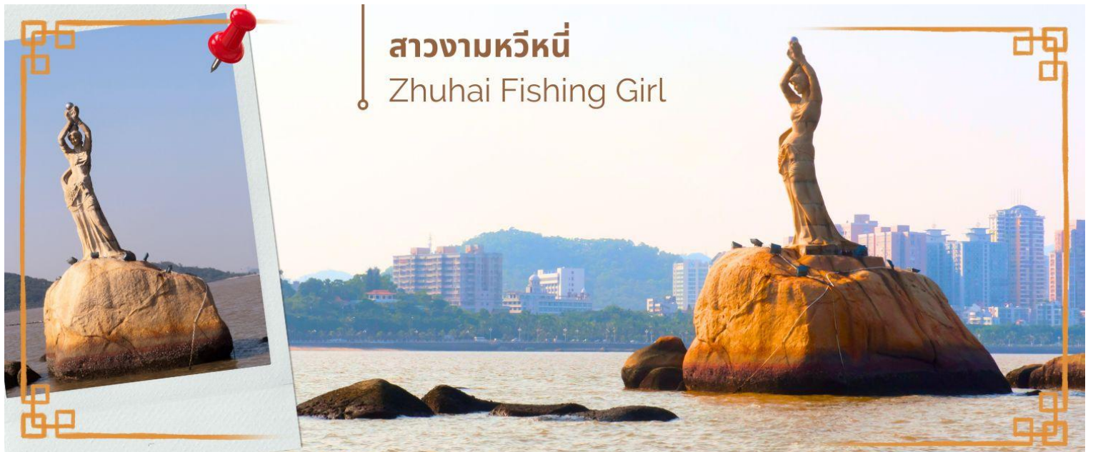
สาวงามหวีหนี่ Zhuhai Fishing Girl

จากนั้นนำท่านสู่ จูไห่ฟิชเชอร์เกิร์ล (Zhuhai Fishing Girl) หรือ สาวงามหวีหนี่ เป็นสถานที่ไฮไลท์ของเมืองจูไห่ ซึ่งเป็นจุดท่องเที่ยวอีกจุดที่สำคัญ ของเมืองนี้ เป็นรูปหินแกะสลักหญิงสาวประมงยื่นชูไข่มุกยื่นออกไปในทะเล ตัดริม ถนนคู่รัก และที่เรียกว่าถนนคู่รักเพราะว่าภายในบริเวณถนนริมชายหาดแห่งนี้ ได้มีการนำเก้าอี้ หรือ ม้านั่ง ซึ่งทำมาสำหรับ 2 คนเท่านั้น จึงตั้งชื่อว่า ถนนคู่รัก