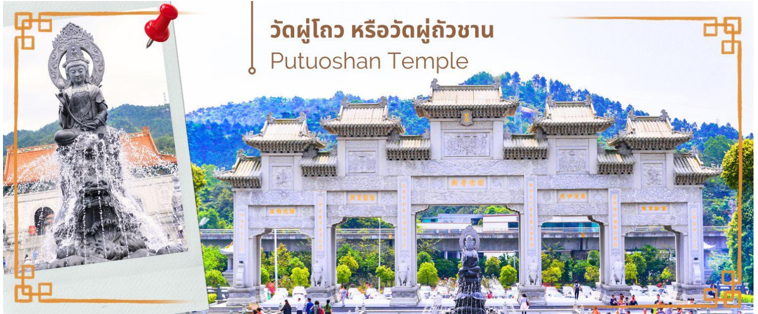
วัดผู้โถว หรือวัดผู้ถัวซาน Putuoshan Temple

จากนั้นนำท่านสู่ วัดผู้โถว หรือวัดผู้ถัวซาน (Putuoshan Temple) ดินแดนอันศักดิ์สิทธิ์ ของพระโพธิสัตว์กวนอิม พุทธศาสนิกายมหายาน พระโพธิสัตว์กวนอิมคืออวตารหนึ่งของพระอมิตาภพุทธเจ้า ซึ่งพระโพธิสัตว์กวนอิม เป็นมหาบุรุษมี วัฒนธรรมโดยรวมกว้างขวางและออกแบบด้วยรูปแบบสถาปัตยกรรมโบราณแบบดั้งเดิม